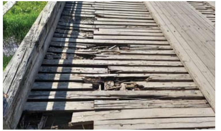
Šioje vietoje - akivaizdžios bėdos.

Kai kurie tilto rąstai jau baidžia visai sutrūnyti, tad tik laiko klausimas, ar nebus bėdos... Turėdama laiko, dar apžiūriu šalia esantį visiškai apleistą,