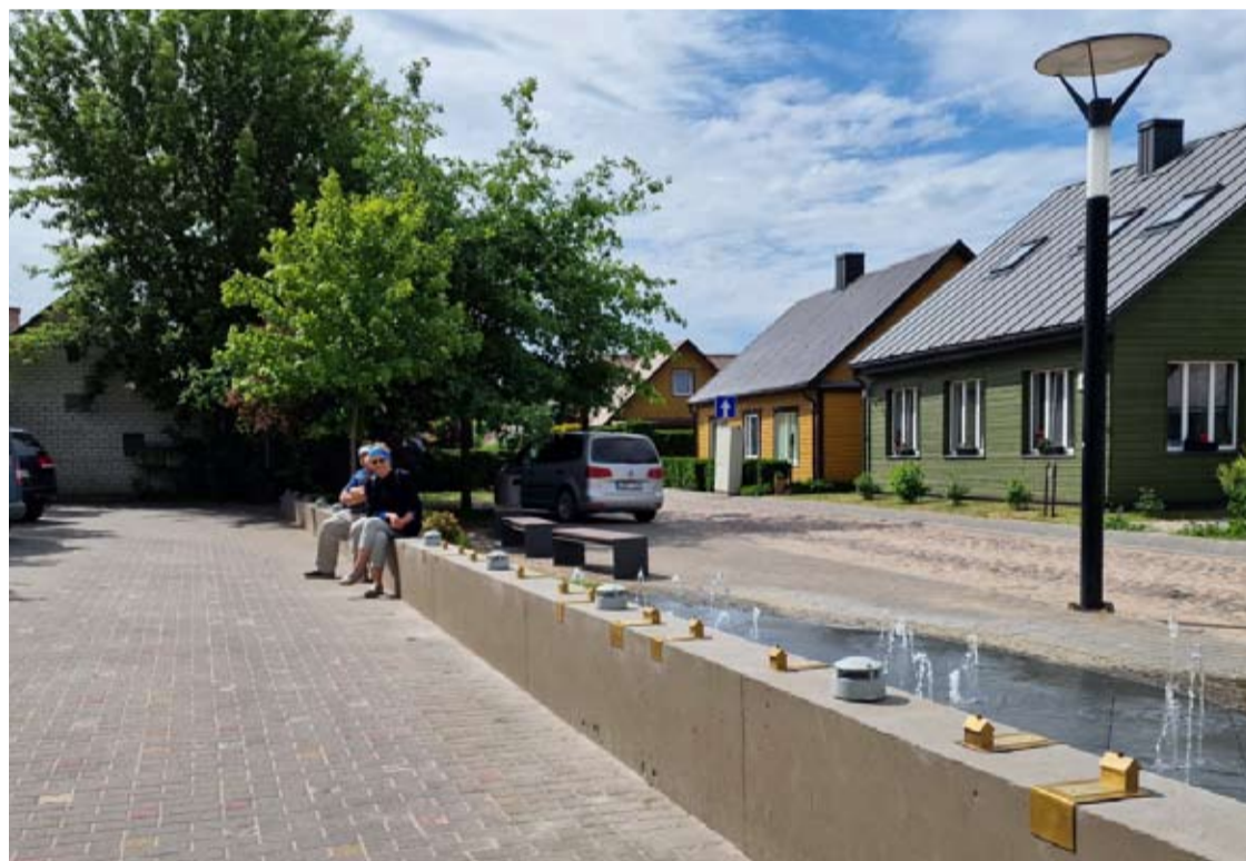
13 žalvarinių žydų namukų maketais atkurtas Anykščiuose buvusių Palestinos ir Sinagogų gatvių kvartalas.